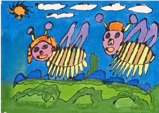
John Siemerink, Bijtjes

Special Arts heeft een grote collectie kunstwerken die zeer geschikt zijn voor kinderkamers of voor ruimtes waar veel kinderen komen , zoals een kinderdagverblijf, een artspraktijk of een consultatiebureau. U vindt de kunst voor kinderen met name in de kunstuitleenruimte. De meeste kunst is te huur en/of te koop.