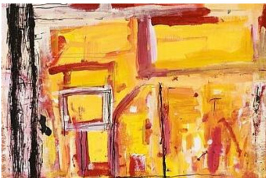
Dorothé Ijszenga, Huis 3