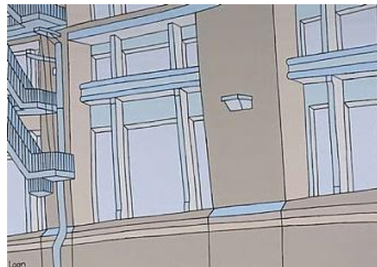
Laan Irodjojo, Gebouw plus trap

Om onze huisvesting te tonen aan alle kunstminnende mensen met een handicap en hun begeleiders én aan relaties en belangstellenden uit Amersfoort en omstreken houden we open huis op zaterdag 16 oktober. Het open huis wordt opgeluisterd met een band met musici met een handicap, met rondleidingen door het pand en uiteraard ook met een hapje en een drankje. Fijn als u ook komt!